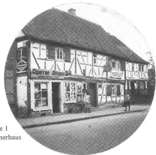
Hauptstraße 1 Pappenheimerhaus

Sohn von 1 und 2. (Siehe Hauptstraße 1 1/10 .) Geb. 25.9.1889 in Dornheim.